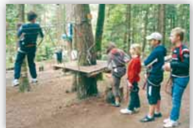
Sortie au Parc aventure