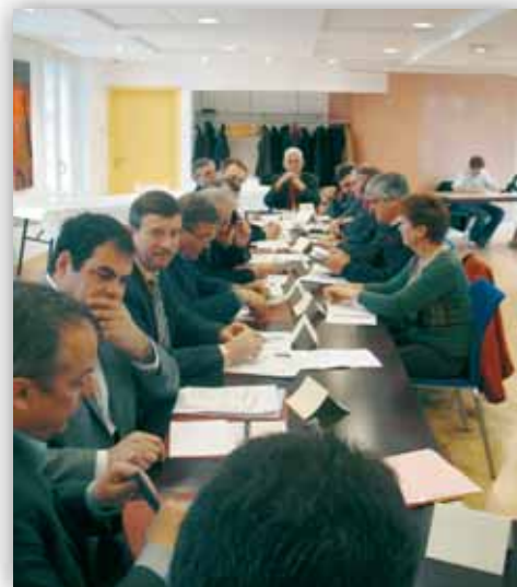
Séance d'installation du conseil le 5 avril 2008, élection du président

Le bureau est composé du président, des vice-présidents et d'un représentant par commune. Il se réunit une fois par mois pour traiter des dossiers qui sont ensuite présentés et soumis à la délibération du conseil communautaire.