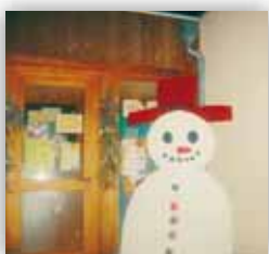
Décors géants de Noël