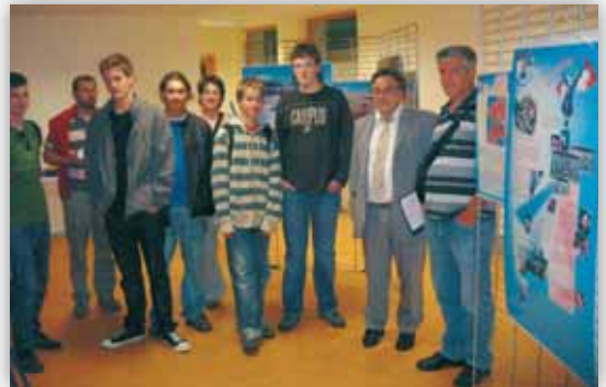
Expo "Supercitoyen" au collège

Dans nos sociétés occidentales, quelles sont les valeurs pouvant permettre à chaque citoyen de trouver sa place, ses repères et son rôle comme acteur de la communauté ?