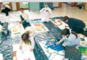
Calicots pour le festival