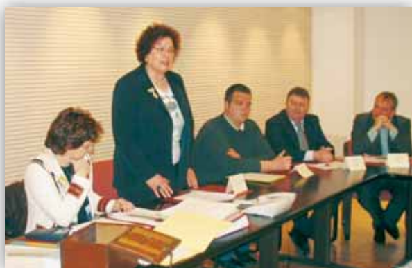
Séance d'installation du conseil le 5 avril 2008, élection du président