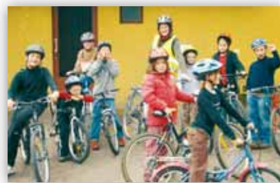
Camp Robin des bois

Pendant les vacances, nous sommes partis une semaine « à la découverte de Robin des bois »... Au programme, fabrication d'arc, tir à l'arc, déplacement en vélo... Nous avons aussi réalisé des mini-films qui ont été projetés durant le mois de juin, pendant le temps périscolaire de midi.